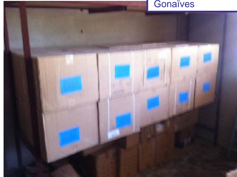
Stock de lait entier à Gonaïves