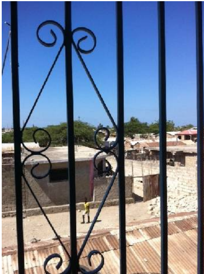
La cité Jubilé, Gonaïves