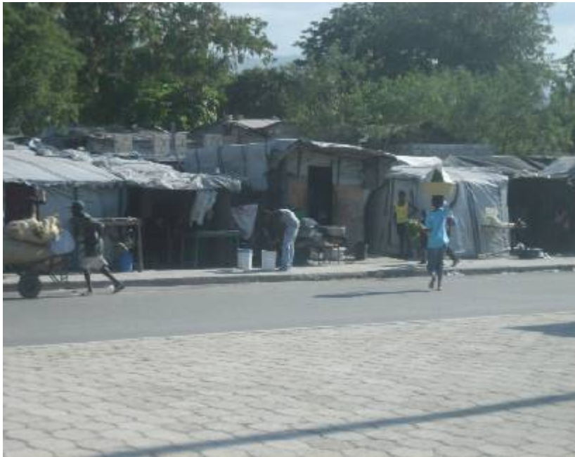
La cité Soleil, Port au Prince